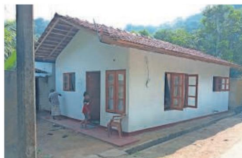
▲ Eén van de nieuwe huizen. Ze zijn 47 vierkante meter groot.

Voor meer info: stichtinghouse4srilanka.nl